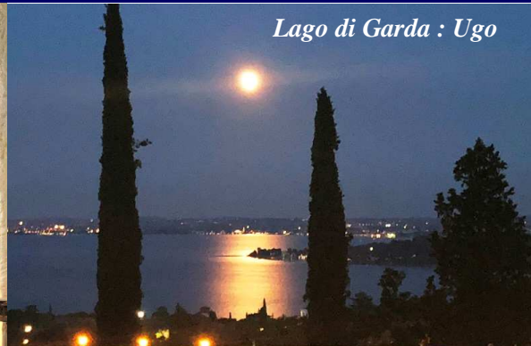
Lago di Garda : Ugo