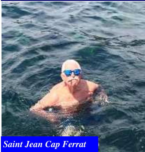
Saint Jean Cap Ferrat